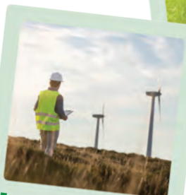
Energie rinnovabili: Eolica, Solare e Biomassa