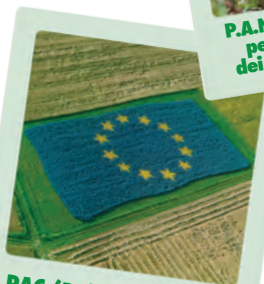
PAC (Politica Agricola Comunitaria)