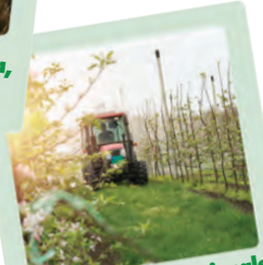
P.A.N. - Piano nazionale per l'uso sostenibile dei prodotti fitosanitari