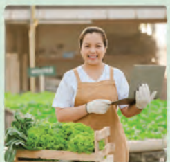
Sicurezza e Igiene Alimentare